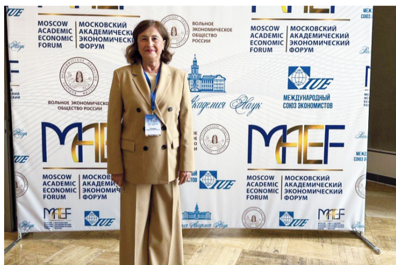
Основные задачи на церемонии открытия ежегодного V Московского экономического форума (МАЭФ-2023) обозначил сопредседатель МАЭФ, президент Вольного экономического общества России Сергей Бодрунов.

– Если мы хотим войти в ядро нового мирохозяйственного уклада, переход к которому стремительно ускорился в связи с обострением геополитической ситуации, нам нужны уникальные конкурентные технологии в медицине, экологии, энергетике, сельском хозяйстве, промышленности, безопасности и других областях. Переход к технологическому прорыву должен стать стержнем новой модели экономического развития страны. У нас есть такой опыт – в советское время был совершен технологический прорыв в космосе, авиации, атомной энергетике, химии. Есть немалые заделы, в том числе в академических институтах, и их надо сохранять и опережающе развивать, – отметил сопредседатель МАЭФ, президент Вольного экономического общества России, президент Международного союза экономистов, член-корреспондент РАН, д.э.н., профессор, директор Института нового индустриального развития имени С.Ю. Витте Сергей Бодрунов.