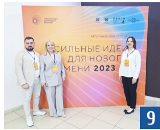
Сильные идеи для нового времени