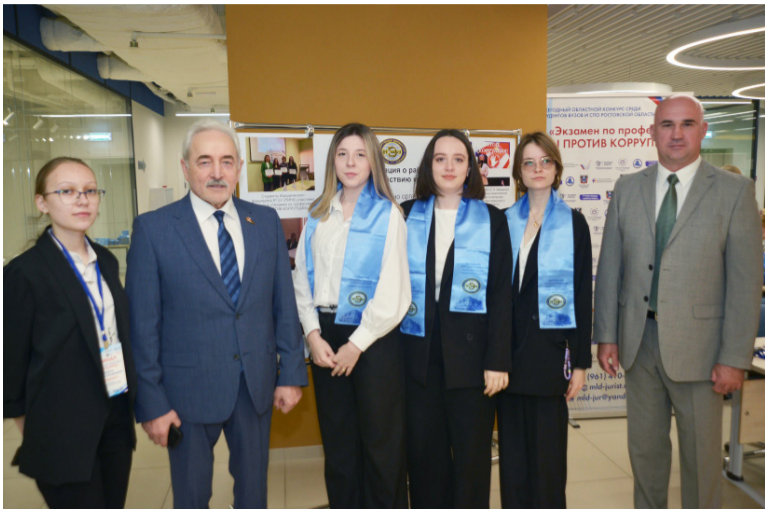
18 мая состоялся финал антикоррупционного конкурса среди студентов вузов и СПО «Экзамен по профессии: МЫ ПРОТИВ КОРРУПЦИИ».

Организаторы конкурса: Региональный штаб Общероссийского народного фронта «За Россию» в Ростовской области; Ростовская региональная молодежная общественная организация «Молодые юристы Ростовской области»; Совет ректоров вузов Ростовской области; Межвузовский центр практической подготовки и профессиональной ориентации студентов вузов Ростовской области (при Совете ректоров вузов Ростовской области).