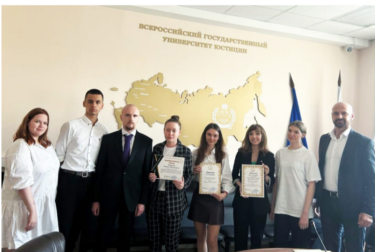
17 мая команда Юридического факультета Ростовского государственного экономического университета (РИНХ) приняла участие в Межрегиональной олимпиаде по гражданскому праву.

Она прошла на базе Ростовского института (филиала) Всероссийского государственного университета юстиции (РПА Минюста России).