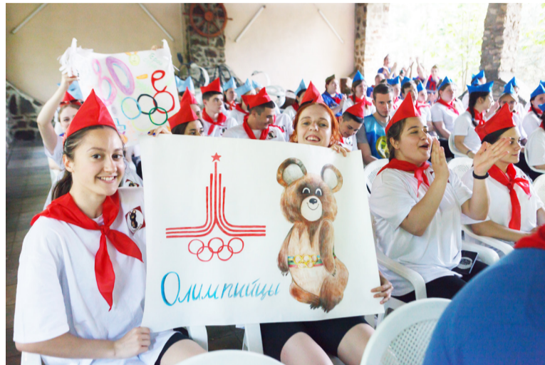
В Таганрогском институте имени А.П. Чехова (филиале) РГЭУ (РИНХ) прошла ежегодная тематическая неделя МДЦ «Артек».

Каждый год студенты и преподаватели проводят цикл мероприятий, связанных с вожатской деятельностью базовой кафедры института МДЦ «Артек» психолого-педагогического образования и медиакоммуникации.