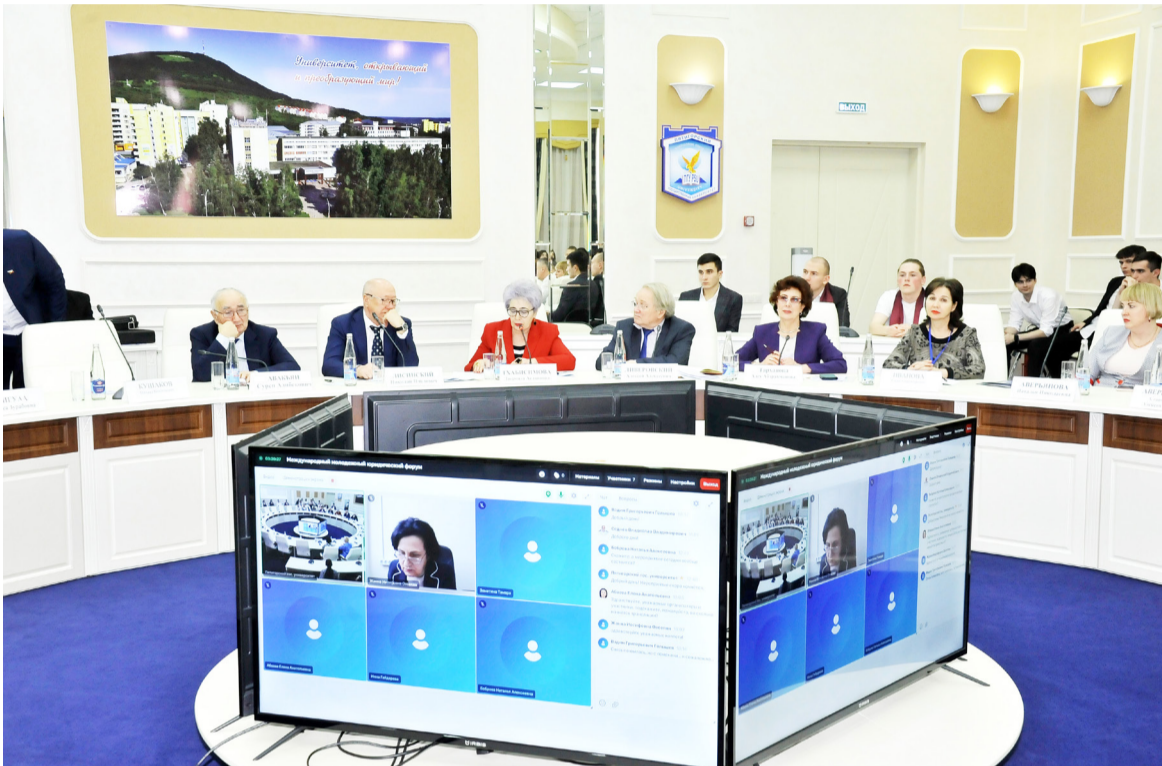
29 марта состоялась III Международная научно-практическая конференция «Педагогическая диагностика: история, теория, современность».

Организатором международной научно-практической конференции выступила кафедра общей педагогики Таганрогского института имени А.П. Чехова (филиала) РГЭУ (РИНХ). На пленарное заседание конференции и секции было прислано 300 заявок: 40 онлайн-докладов, видеодокладов и презентационных докладов. В качестве слушателей конференции было заявлено 200 человек, 60 человек подали статьи в электронный сборник материалов конференции.