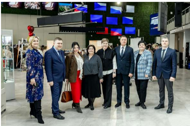
Представители кафедры психологии приняли участие в пятом, юбилейном, Уроке доброты «Единство добрых сердец – богатство великой России», организованном АНО «Луч Надежды» на площадке музейного комплекса «Самбекские высоты».