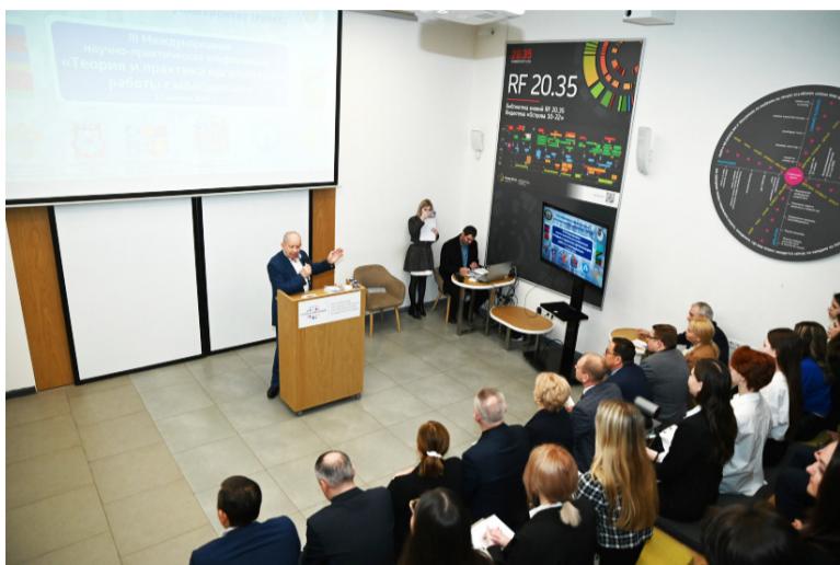
22 марта в РГЭУ (РИНХ) состоялась III Международная научно-практическая конференция «Теория и практика организации работы с молодежью».

Конференция организована кафедрой экономической теории факультета Торгового дела совместно с Донским Союзом молодежи, комитетом по молодежной политике РО, Общественной палатой РО, отделом по делам молодежи г. Ростова-на-Дону, Межрегиональной общественной организации «Работающая молодежь Юга».