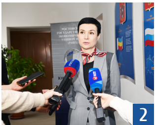
Конституции РФ – 30 лет