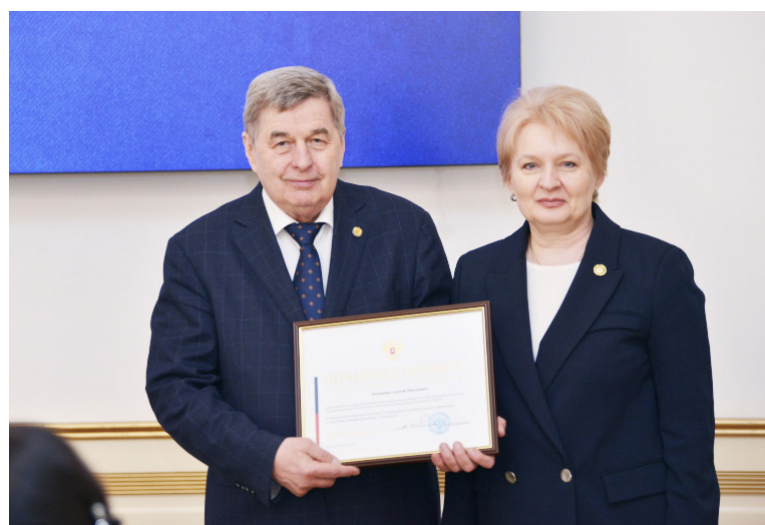
5 марта в Ростовском государственном экономическом университете (РИНХ) состоялось заседание Ученого совета.