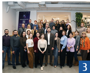
Стратегическая сессия для преподавателей