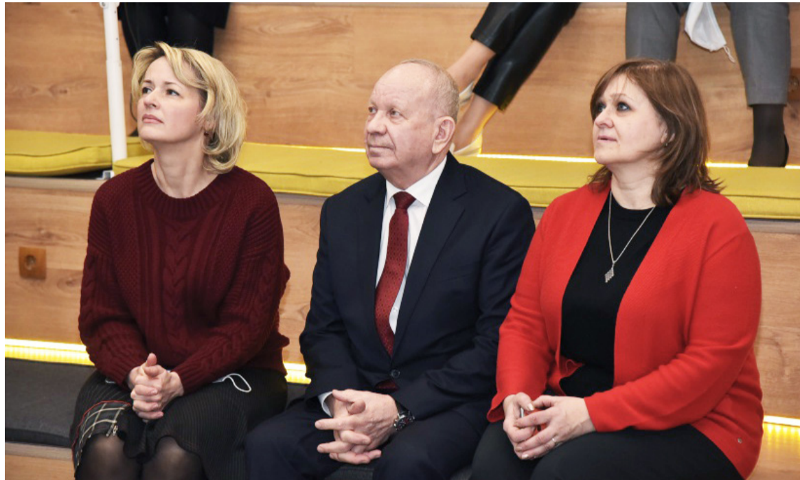
15 марта в РГЭУ (РИНХ) проходила международная научно-практическая конференция «Технологии стратегического управления в современном мире».

Представители научного сообщества России, Болгарии и Беларуси обсудили вопросы современного социально-экономического развития и проанализировали инструменты и механизмы комплексного стра-