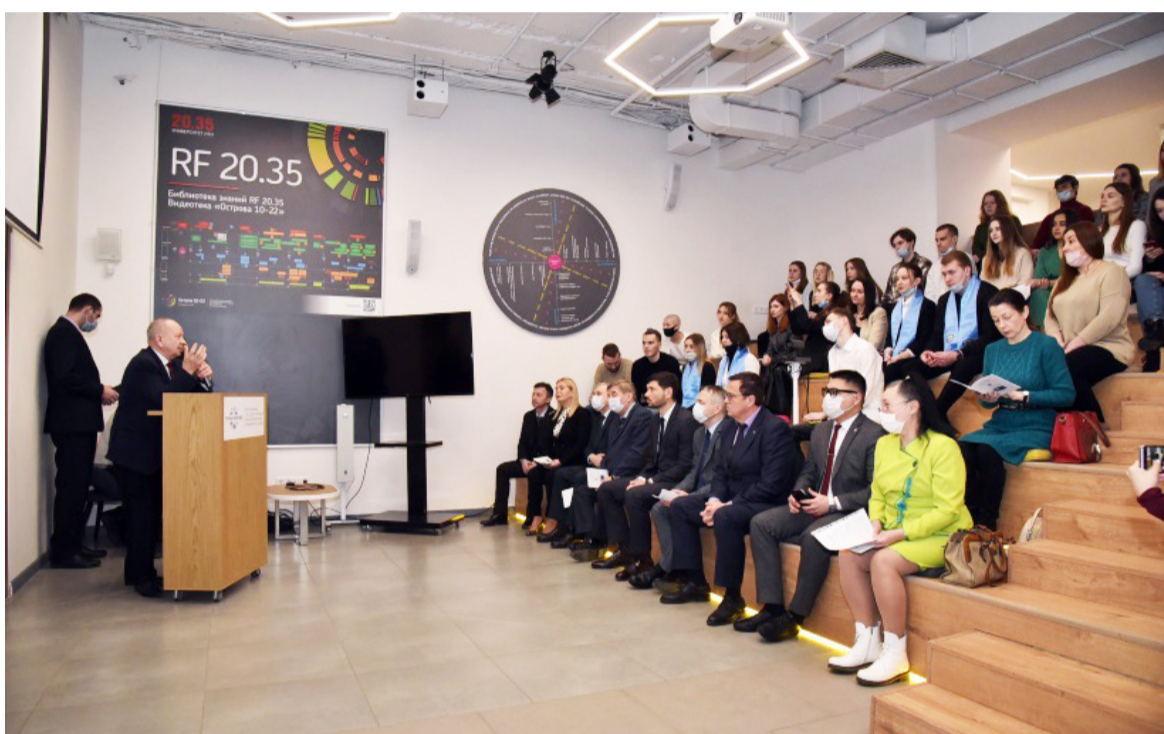
18 марта на площадке Точки кипения РГЭУ (РИНХ) состоялась международная научно-практическая конференция «Теория и практика организации работы с молодежью».

Организатором конференции выступили кафедра экономической теории и факультет Торгового дела РГЭУ (РИНХ) при содействии Донского союза моло-