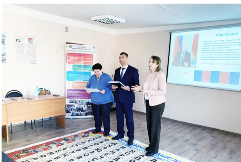
24 февраля на факультете Экономики и права Таганрогского института имени А.П. Чехова (филиала) РГЭУ (РИНХ) прошла патриотическая деловая игра «Русский мир – территория смыслов».