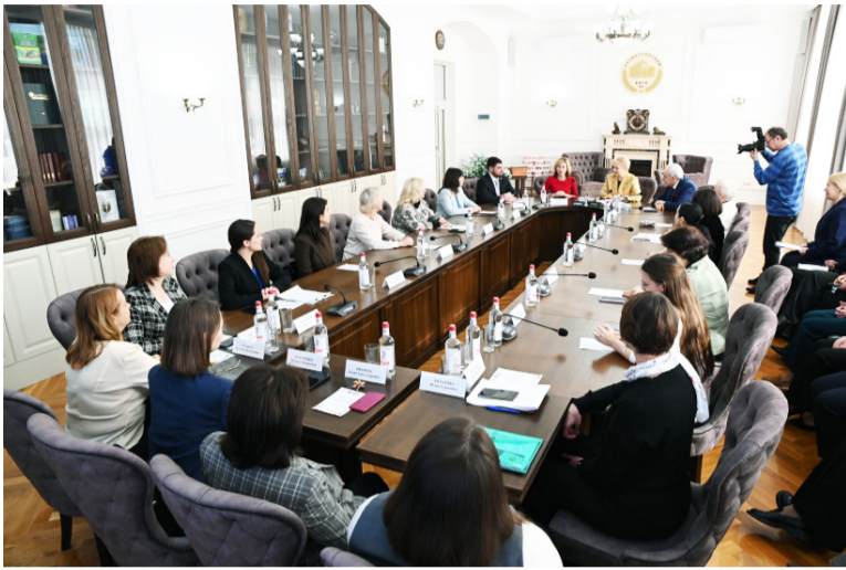
1 марта в РГЭУ (РИНХ) состоялся круглый стол «Наука с женским лицом. Преемственность поколений и наставничество» с участием депутата Госдумы Федерального Собрания РФ Екатерины Стенькиной при поддержке Общественной палаты Ростовской области.

Обсуждение актуальных вопросов в преддверии Дня 8 марта инициировано депутатом ФС РФ Екатериной Стенькиной и нацелено на открытый диалог между женщинами-учеными, молодыми преподавателями и студентами о роли женщин-ученых в вопросах научного наставничества, достижениях женщин университета в науке, направлениях совершенствования мер поддержки ученых.