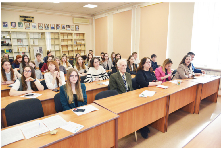
1 марта на факультете Лингвистики и журналистики РГЭУ (РИНХ) прошла VI Международная научно-практическая конференция «Журналистика в современном мире».

Конференция прошла при поддержке Ростовского отделения Союза журналистов России, ООО «Союзники» (Медиагруппа РБК Юг и Северный Кавказ), Ростовского регионального отделения Межрегиональной общественной организации «Общество российско-китайской дружбы».