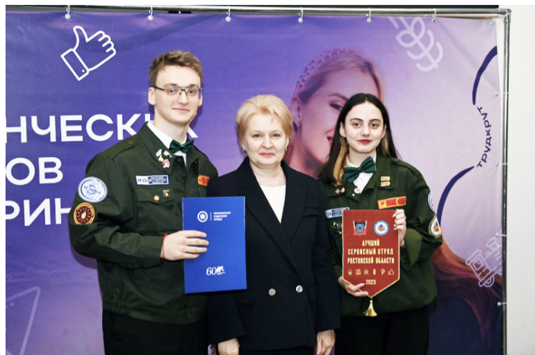
День Российских студенческих отрядов отметили в Ростовском государственном экономическом университете (РИНХ).

День Российских студенческих отрядов – праздник, близкий каждому бойцу студотрядов всех поколений. Праздник, хранящий 65-летнюю историю движения.