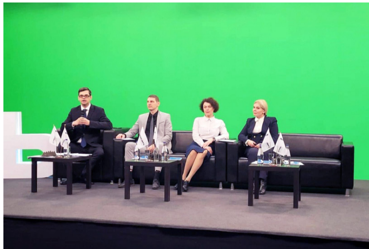
3 марта издательский дом «Коммерсантъ» провел конференцию «Вузы в ESG-повестке: возможности и перспективы».

ESG расшифровывается как «экология, социальная политика и корпоративное управление». В широком смысле это устойчивое развитие коммерческой деятельности, которое строится на принципах ответственного отношения к окружающей среде (E – environment), высокой социальной ответственности (S – social), высоком качестве корпоративного управления (G – governance). В России принципы ESG менее распространены, чем за рубежом, но их постепенно внедряют в бизнес. Одной из актуальных тем Петербургского международного экономического форума (ПМЭФ) в 2021-м стала защита окружающей среды.