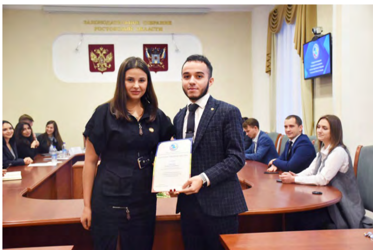
В канун Нового года состоялось заседание президиума Молодежного парламента при Законодательном Собрании Ростовской области.

В ходе заседания председатели комиссий выступили с отчетом о реализации планов за второе полугодие и утвердили план на первое полугодие 2020 года.