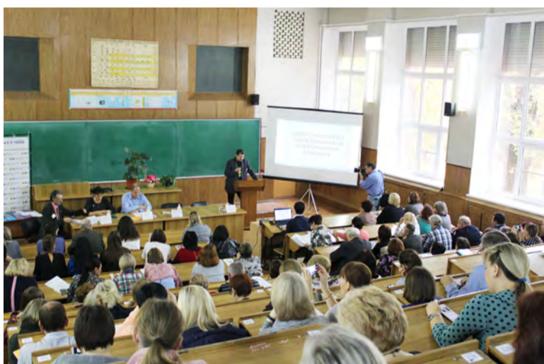
В этом учебном году освоение студентами цифровых образовательных технологий осуществлялось на базе платформы «ЯКласс» – резидента инновационного центра Сколково, образовательном интернет-ресурсе для школьников, учителей, родителей и студентов.

В учебный процесс были вовлечены 24 класса (275 человек), составленных из студентов института, слушателей центра повышения квалификации и школьников.