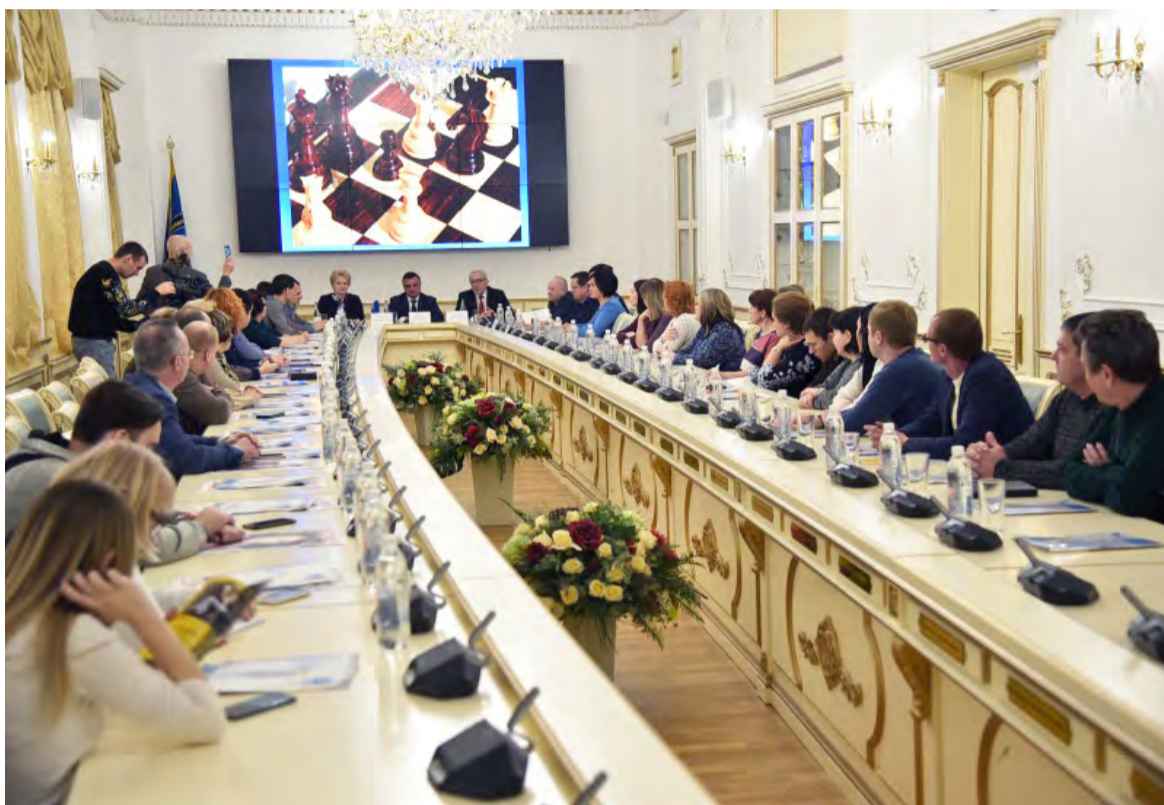
22 января на базе Ростовского государственного экономического университета (РИНХ) прошел открытый круглый стол в рамках проведения курсов повышения квалификации по программе «Педагогические технологии реализации шахматного всеобуча».