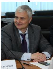
Шеховцов Роман Викторович

Заместитель министра экономического развития Ростовской области