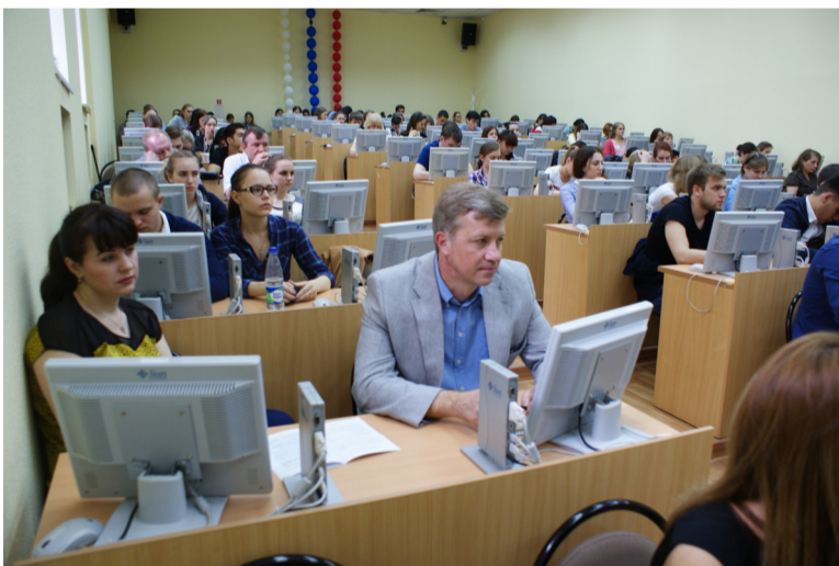
27 мая, в Ростовском государственном экономическом университете (РИНХ) состоялось открытие IV Международной научно-практической конференции «Статистика в современном мире: методы, модели, инструменты».

Организатором мероприятия выступил Учетно-экономический факультет вуза.